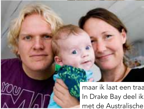
Jinne en ik met onze inmiddels geboren zoon xxxxxx.