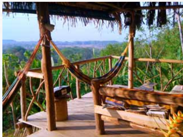
De Tipi Jungla Ecolodge.