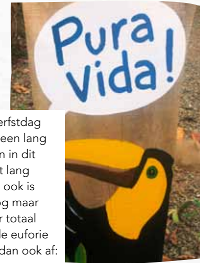
Pura Vida, klinkt goed!

Mijn voeten doen zo'n pijn dat ik ze in een chic restaurant zonder schaamte onder de kraan steek en in paniek googel of ze niet zullen afsterven