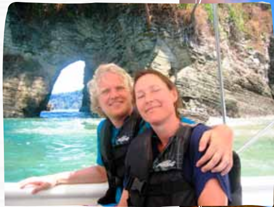
Veilig op de boot.