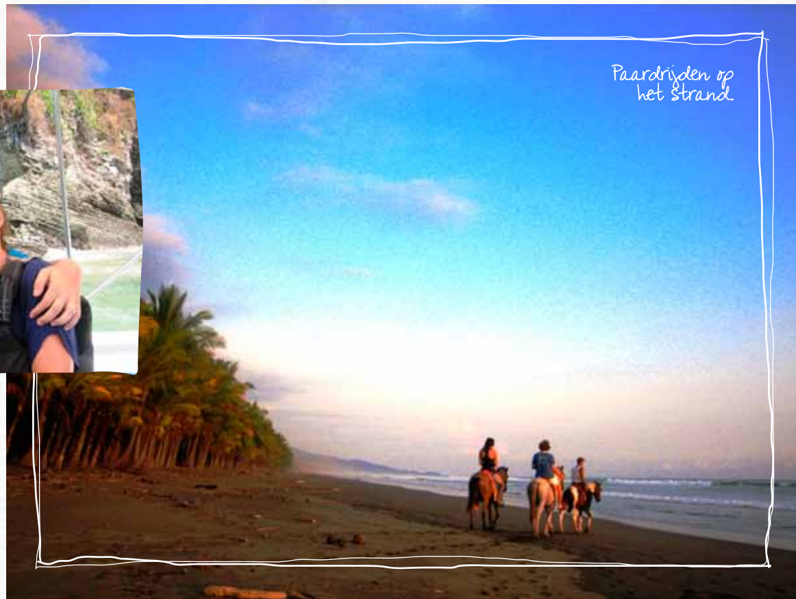
Paardrijden op het strand.